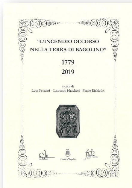
L'incendio occorso nella terra di Bagolino 1779-2019