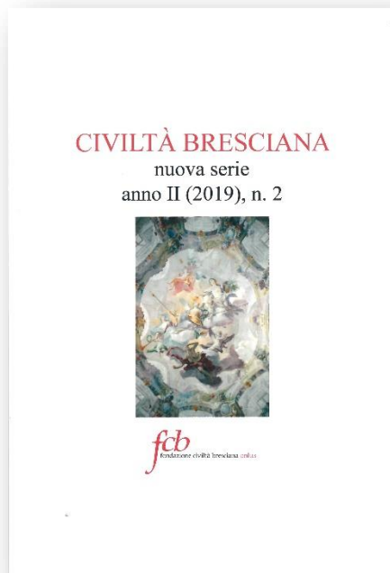
Rivista Civiltà Bresciana n. II/2019