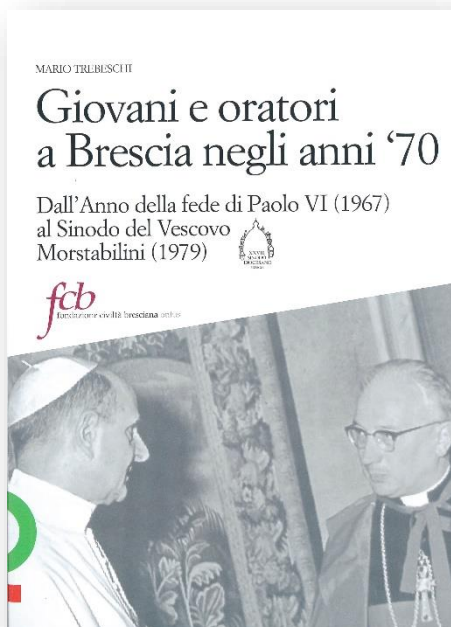
Quaderni di storia dell'Oratorio bresciano 6. Giovani e oratori a Brescia negli anni '70