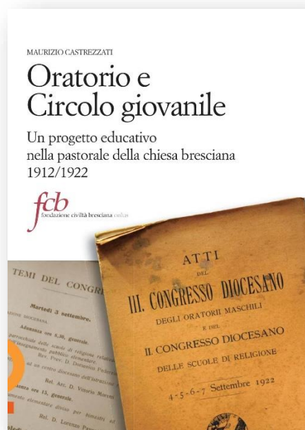
Quaderni di storia dell'Oratorio bresciano 5. Oratorio e Circolo giovanile