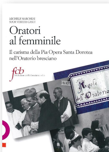
Quaderni di storia dell'Oratorio bresciano 4. Oratori al femminile