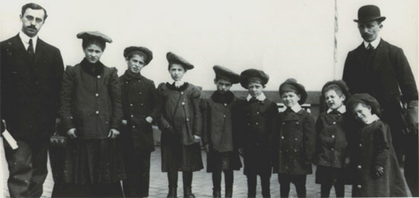
Orphan children - Mothers killed in Russian Massacre - Oct. 1900; SS "Caronia" May 1901