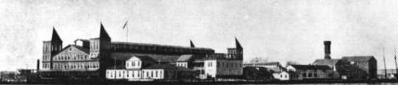
Main Building circa 1892