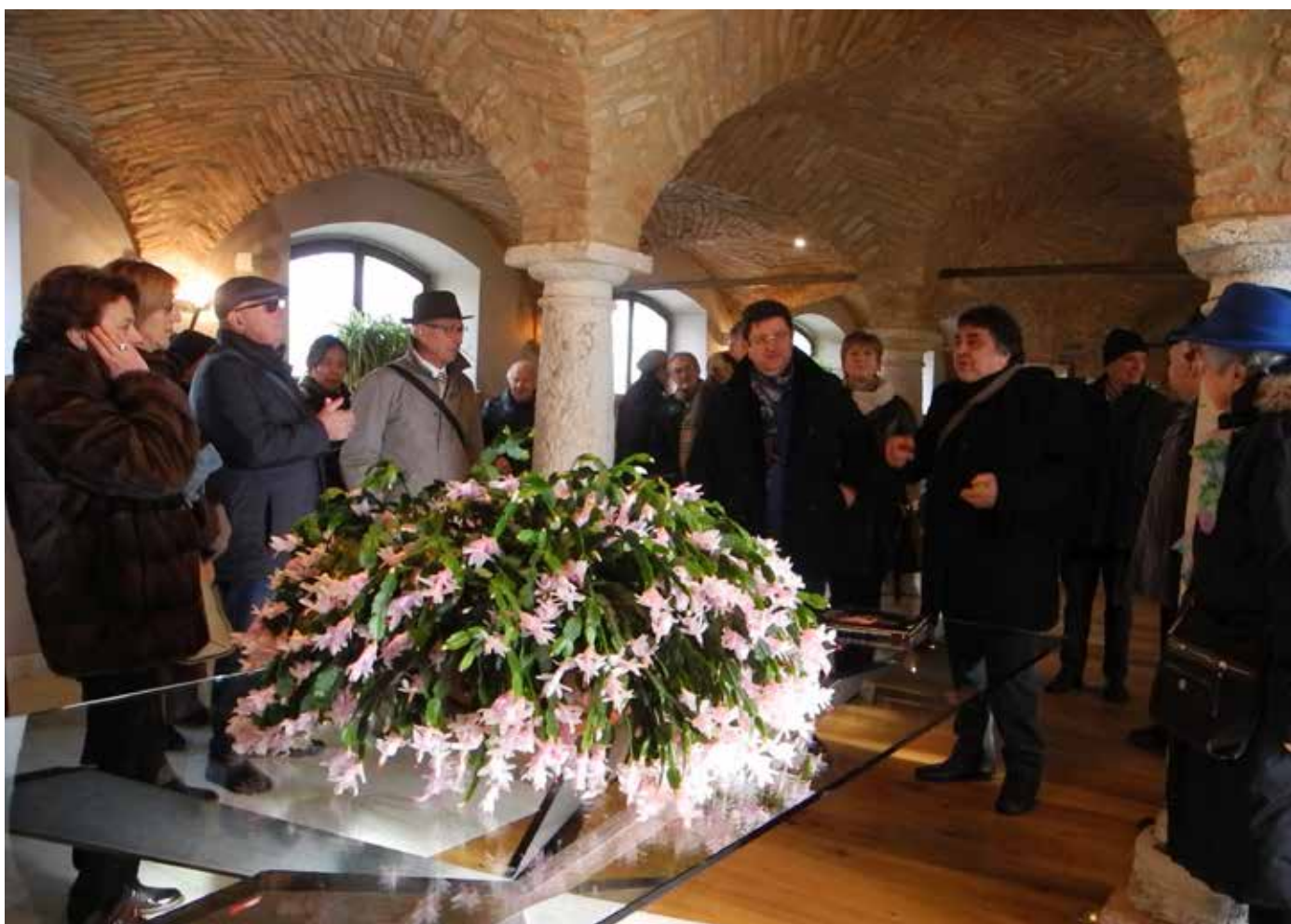
Viste all'interno del corpo di fabbrica, di fattura cinquecentesca, già adibita a stalla per bovini ed ora prestigioso ambiente per ricevimenti e manifestazioni promozionali.