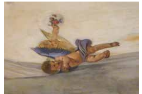
Scatti sulle opere d'arte all'interno di S. Antonio Abate, dai preziosi altari in pietre dure lavorate a commesso, alle pitture su tela e a pareti o sulla volta con gli affreschi di Vittorio Trainini.