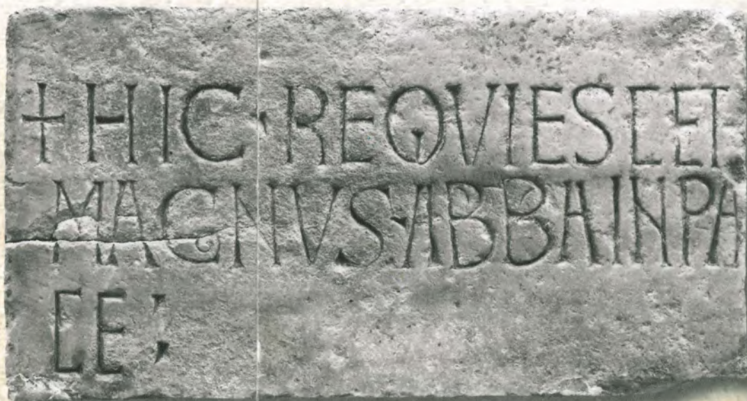
Epitaffio dell'abate Magno (Museo Cristiano - Brescia)